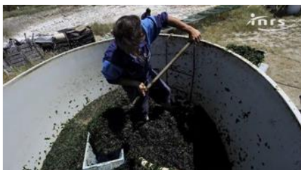
Travail et fortes chaleurs (Anim-154)

De nombreux métiers obligent les salariés à évoluer dans des environnements marqués par des températures élevées : teintureries, blanchisseries, cuisines, mines, hauts fourneaux, fonderies, ateliers de soudure... D'autres personnes travaillent en extérieur et peuvent être exposées à la chaleur, notamment en été lors des épisodes caniculaires. Ces ambiances thermiques peuvent avoir de graves effets sur la santé et augmenter les risques d'accidents du travail.