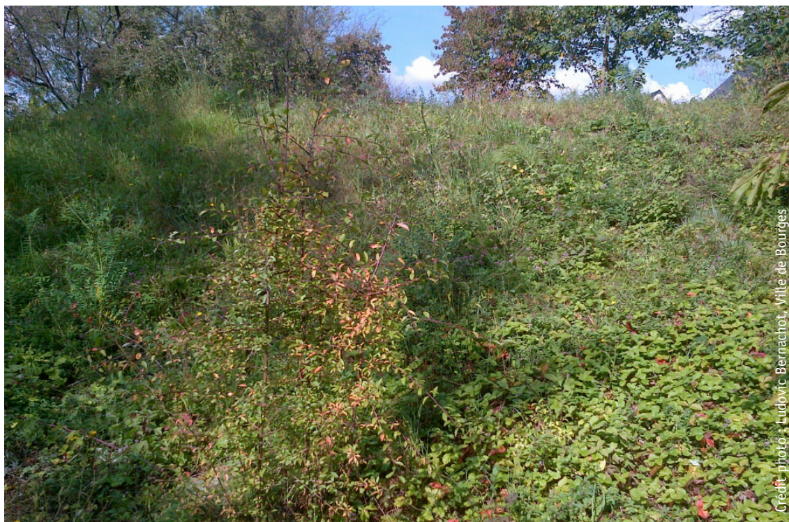
Un exemple de préservation d'un milieu calcaire pauvre en matières organiques et de la diversité floristique et faunistique qu'il accueille. Jardin de Lazenay, labellisé EcoJardin en 2014, Bourges (18).

Les sols en espaces verts font souvent l'objet d'apports (amendements et fertilisation), mais les stratégies utilisées doivent correspondre à de réels besoins et respecter certains principes.