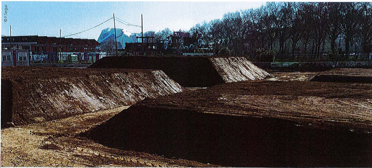
Nouvelles expérimentations de production de Ternatec dans le quartier du Champs à Lyon Confluence.