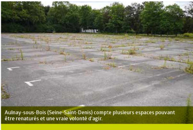
Aulnay-sous-Bois (Seine-Saint-Denis) compte plusieurs espaces pouvant être renaturés et une vraie volonté d'agir.

tion à plusieurs échelles, communes, intercommunalité, département. Un potentiel qui devra ensuite être vérifié sur le terrain », ajoute l'écologue. Ainsi, 30 535 hectares d'espaces minéralisés potentiellement renaturables ont été identifiés, ce qui correspond à 2,54 % du territoire régional. Sur ce chiffre, 7 017 hectares environ, s'ils étaient renaturés, « apporteront un bénéfice au niveau des trois enjeux : biodiversité, changement climatique et santé ».