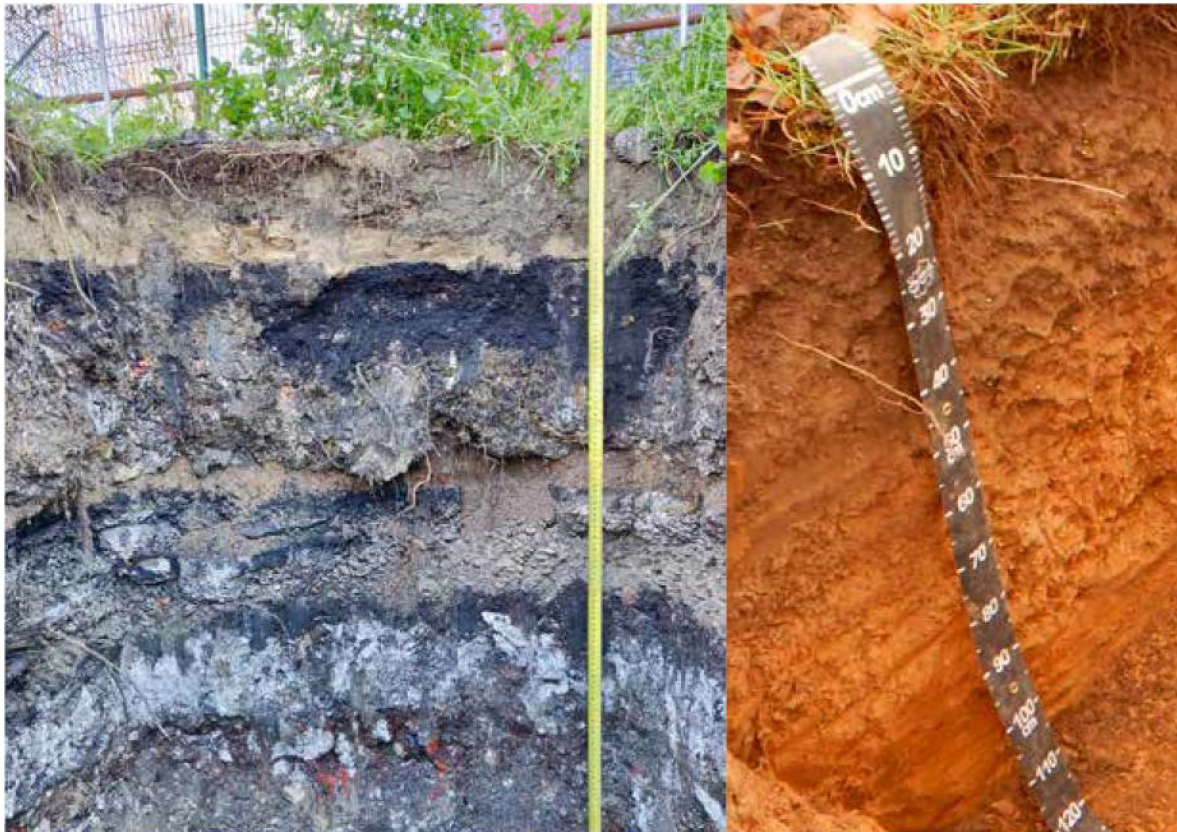
Tenir compte de l'état des sols (artificialisé à gauche, naturel à droite) dans les PLUi a pour but d'aider les collectivités à choisir les zones à protéger et celles à densifier.