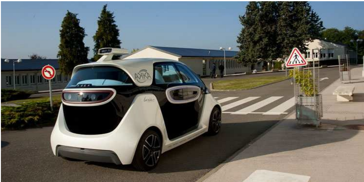
Link&Go, véhicule électrique intelligent bi-mode pouvant se conduire et se garer avec ou sans conducteur, fruit de la collaboration Inria - AKKA Technologies.

Au moment de la COP21, on peut se demander à juste titre quelle sera la place de la voiture dans la ville du futur. On voit en effet se multiplier les annonces sur la réduction de l'espace pour circuler, la suppression de places de parking, les péages urbains, l'interdiction des 4x4, etc. Pourquoi tant d'animosité envers ce merveilleux outil de liberté que chacun désire dès son plus jeune âge ?