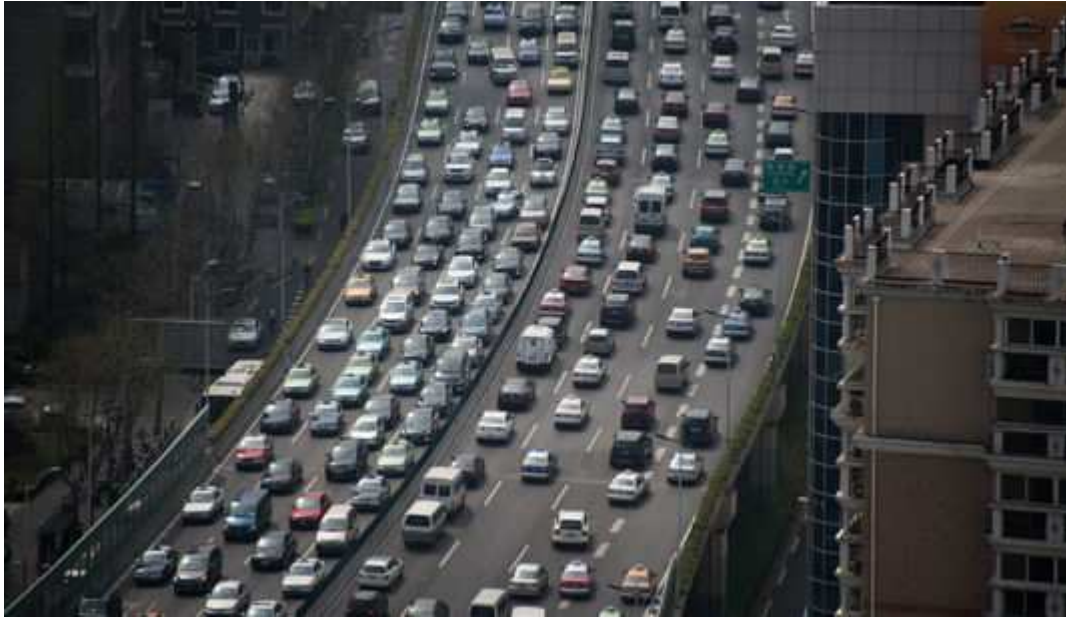
A Shanghai, en Chine, en 2015.

LE MONDE | 06.07.2016 à 12h34 • Mis à jour le 06.07.2016 à 14h41 | Par Éric Béziat