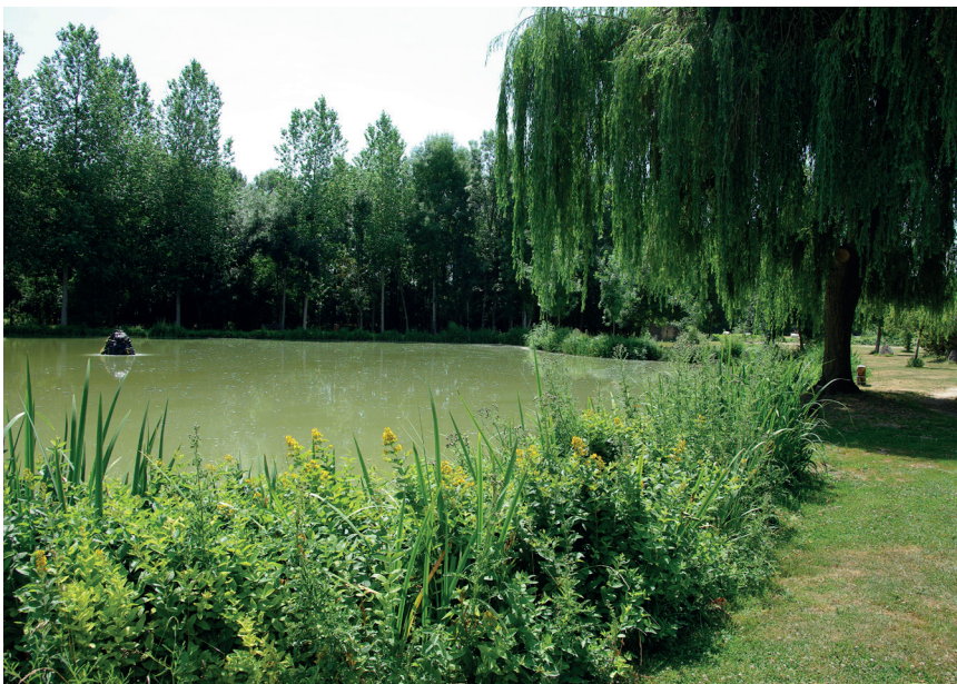
Gestion écologique et végétation de bord de rive à Sainte- Soline (79)