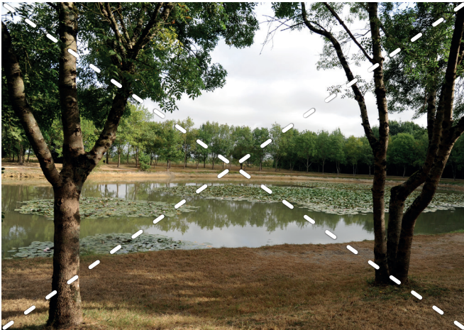
Gestion intensive non justifiée (photo supérieure)

Deux exemples différents de gestion des abords d'un plan d'eau