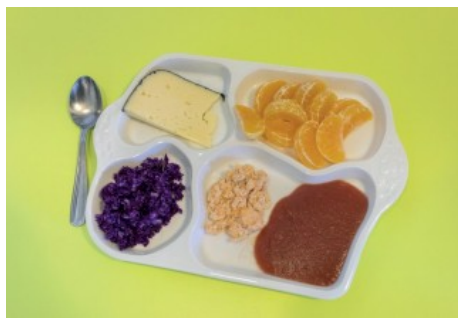
Présentation de l'assiette en porcelaine à la crèche Jean-Dufour

Cet engagement à la réduction des perturbateurs endocriniens auprès des enfants initié à la crèche Joliot-Curie, s'étend désormais à l'ensemble des établissements d'accueil des jeunes enfants de Limoges.