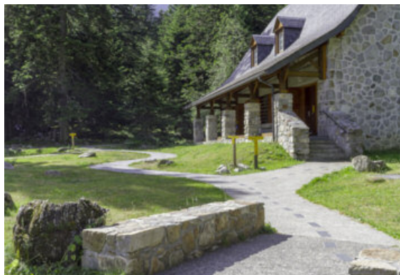
Dans le Parc national des Pyrénées, le guidage est assuré par des « fils d'Ariane » constitués de « modules » métalliques, noyés dans le béton, qui matérialisent un chemin à suivre depuis le stationnement jusqu'aux panneaux. Ces boîtiers sont creux et raisonnent différemment à la canne, ce qui facilite le guidage.

L'ensemble de ces dispositifs de guidage permettent aussi aux personnes déficientes intellectuelles et plus globalement à tous, de suivre plus facilement le parcours et de rester dans les zones ouvertes au public.