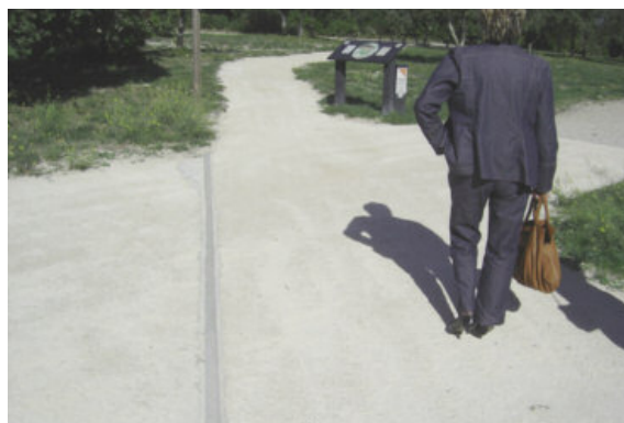
À Nîmes : la différence de revêtement permet une distinction facile entre le cheminement et ses abords. À l'approche d'un panneau d'information, un rondin de bois posé au sol en bordure du cheminement constitue une alerte (tactile et sonore). Au niveau des croisements avec des cheminements non-aménagés, une bordure en béton noyée (laissant un ressaut de 2 cm environ) vient constituer un « fil d'Ariane » permettant à la personne aveugle ou malvoyante de suivre le bon itinéraire.

Ce logo est en relief et facilement identifiable par le dessin et la couleur bleue. Attention toutefois à l'emploi de vis cruciformes, qui nécessite une vigilance particulière : les têtes de vis ne doivent pas ressortir ou doivent être correctement limées.