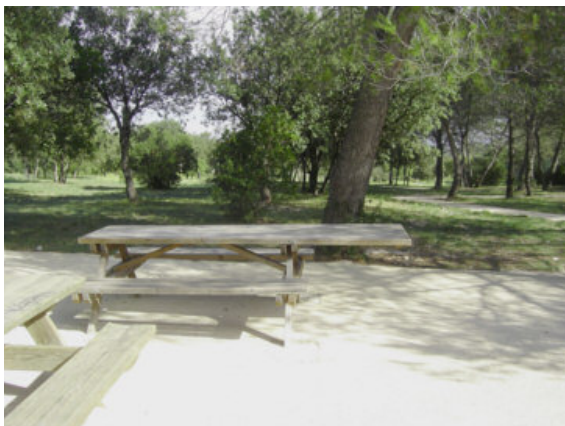
Nîmes : présence de mobilier adapté pour le repos et les pique-niques

Dans ce cas, il convient de s'assurer de l'accessibilité de ce dernier.