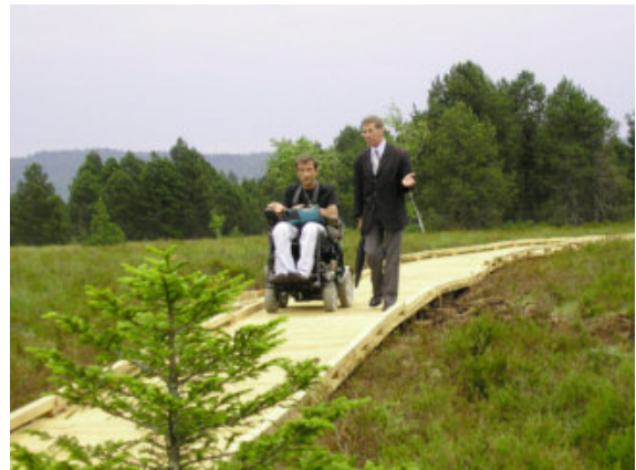
Caillebotis sur le site des Tourbières de Frasné et l'Etang de La Rivière Drugeon.

Par contre, il convient d'être particulièrement vigilant sur le sol et sur la largeur du cheminement. Si l'idée n'est pas de transformer les espaces naturels en espace public urbain en utilisant des matériaux de type bitume ou enrobé, plusieurs types de sols peuvent être mis en place, selon le contexte, pour améliorer le caractère roulant du cheminement : caillebotis en bois, sable, gravier ou roche concassée stabilisés, tissus renforcés..., pourvu qu'ils soient durs, adhérents, sans obstacle.