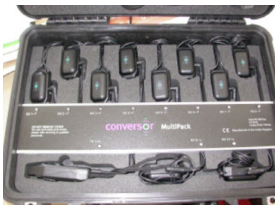
Coffret comprenant un micro et des récepteurs, acheté par la commune de Fouesnant-les-Glénan (29) et mis à disposition des déficients auditifs appareillés, afin de leur permettre de suivre les explications lors de sorties guidées

Enfin, selon la configuration et les contraintes des lieux, l'accès à certains sites naturels (ou à certains secteurs) n'est possible qu'avec un accompagnement par une personne en charge de l'animation et de l'interprétation du site.