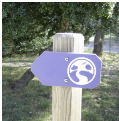
Nîmes : le cheminement accessible est balisé par des panneaux portant un logo spécifique.

Ce logo est en relief et facilement identifiable par le dessin et la couleur bleue. Attention toutefois à l'emploi de vis cruciformes, qui nécessite une vigilance particulière : les têtes de vis ne doivent pas ressortir ou doivent être correctement limées.