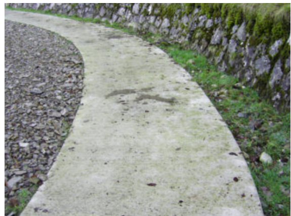
Dans le Parc national des Pyrénées, les cheminements ont été réalisés en béton, ce qui a permis d'assurer la « roulabilité » et le confort des mal-marchants, le contraste (visuel et tactile) tout en restant relativement « transparent » de manière à ne pas dénaturer le site et la pérennité de l'aménagement (peu sensible aux contraintes climatiques, facile à entretenir).

Il convient par contre de ne pas négliger l' entretien du cheminement . Orties, ronces ou simples plaques d'herbes rendent rapidement le trajet compliqué aux personnes handicapées comme aux personnes valides. L'automne et ses feuilles mortes sont aussi un élément à prendre en compte dans le planning d'entretien, notamment pour les espaces boisés. Il convient donc de nettoyer les cheminements dans le cadre d'une gestion écologique, les végétaux devront être déplacés ou compostés sur place et non exportés.