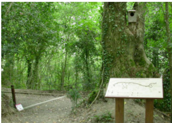
Sentier de Penfoullic : le plan en relief braille et la borne sonore

Plusieurs préconisations sont à prendre en compte pour le mobilier d'interprétation . Pour les pupitres, il convient de prévoir un espace libre de 70 cm en-dessous pour permettre le passage du fauteuil.