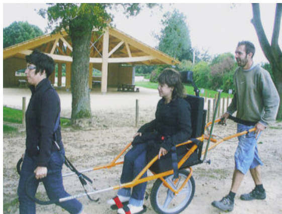
Mise à disposition de « Joëlette » - Peuton (53)

Tous ces questionnements font que certains gestionnaires ont pris le parti, non d'une amélioration de l'accessibilité par des travaux, mais d'un investissement important auprès des animateurs associé à une mise à disposition de matériel adapté : kit portable avec casques audios permettant à plusieurs personnes malentendantes de suivre un guide ou un conférencier en extérieur, fauteuil roulant tout-terrain mono-roue destiné à faciliter le déplacement des personnes déficientes motrices.