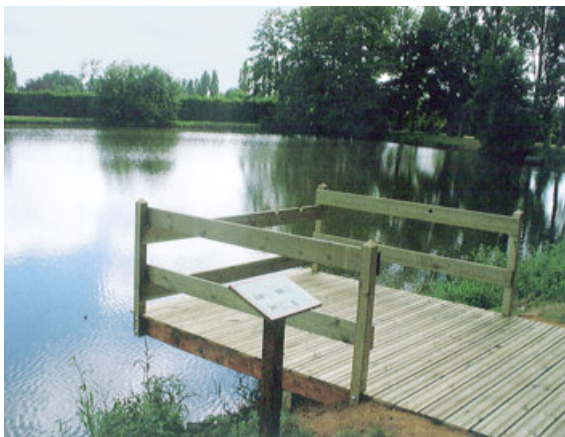
Ponton de pêche accessible sur l'étang communal - Peuton (53)

Se pose enfin la question des sanitaires, peu compatibles avec un espace naturel.