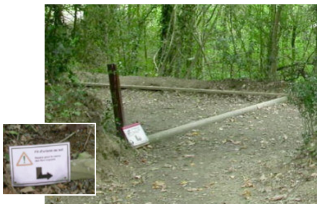
Sur le sentier de Penfoullic (commune de Fouesnant-les-Gréven) : départ du « fil d'Ariane » avec guidage par un rondin de bois.

Quand le gestionnaire a aménagé le site pour pouvoir accueillir des personnes handicapées, il est important de prévoir une signalétique directionnelle qui convienne à tous les publics, y compris aux handicaps visuel ou mental. Cela concerne aussi tous les plans et éléments de jalonnement installés sur l'itinéraire.