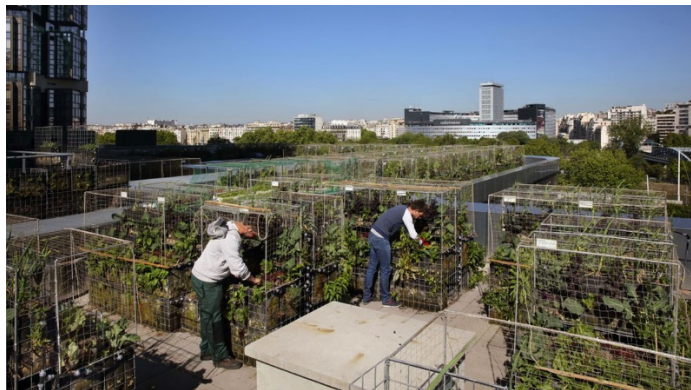
La ferme urbaine Peas & Love sur le toit d'un hôtel dans le quartier Grenelle de Paris.

L'équation économique semble difficile à résoudre, même si l'agriculture en ville n'est pas non plus sans intérêt. « Il peut être très pertinent de cultiver en ville tous ces aliments qui nécessitent un environnement contrôlé, en 'indoor' », estime Christine Aubry, directrice de recherche agriculture urbaine à AgroParisTech. La lavande pour les cosmétiques ou les herbes aromatiques,