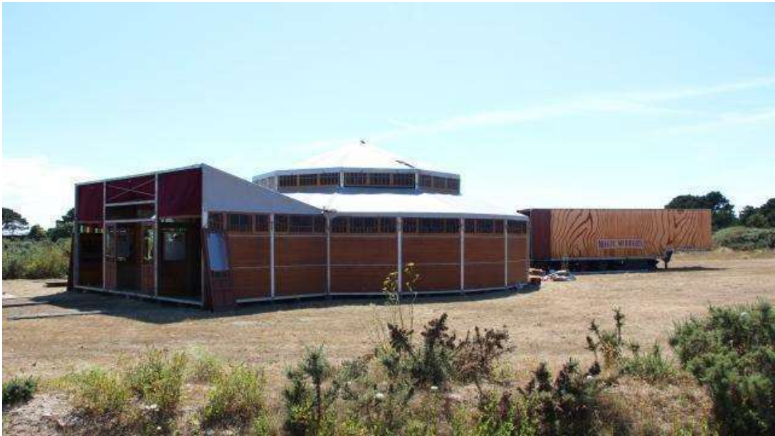
Le Magic Mirrors ouvrira le vendredi 29 juillet à Treffiagat (Finistère).

La prochaine ouverture de la discothèque éphémère, le Magic Mirrors, à Treffiagat (Finistère), provoque la colère des patrons de discothèques du Finistère. Pour les organisateurs, il y a un manque à combler.